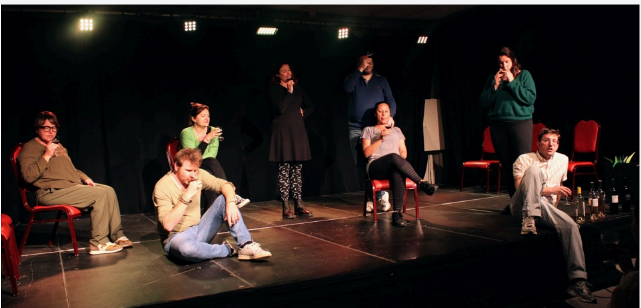
Stage avec Impro2Pro

À la fin du stage, vous aurez un format prêt à jouer !